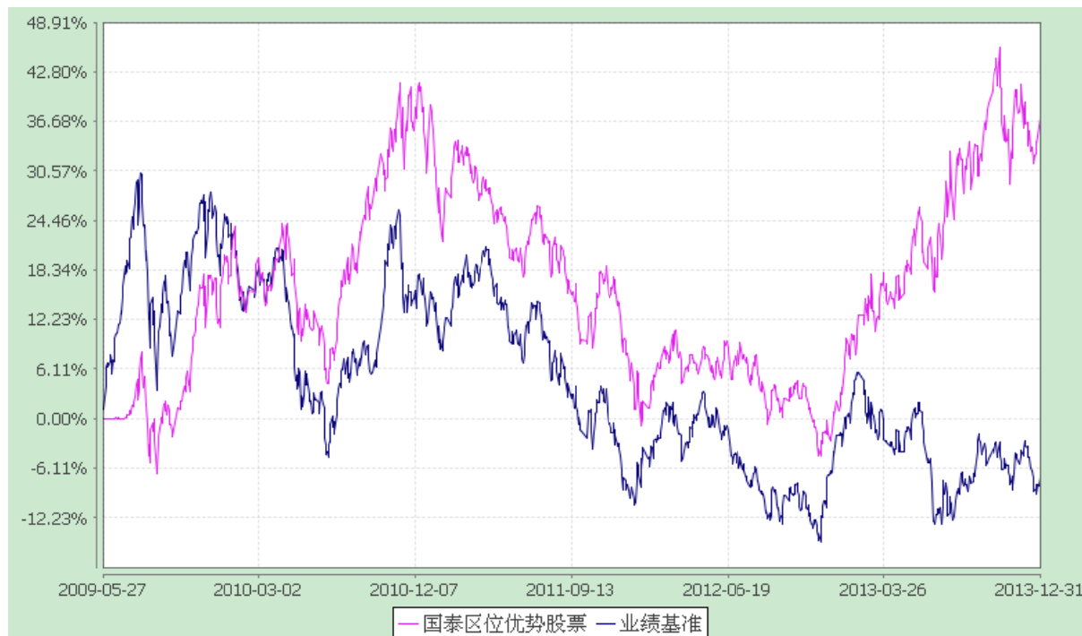
自基金合同生效以来基金份额累计净值增长率与业绩比较基准收益率的历史走势对比图 (2009 年 5 月 27 日至 2013 年 12 月 31 日)

注：本基金的合同生效日为 2009 年 5 月 27 日。本基金在六个月建仓期结束时，各项资产配置比例符合合同约定。