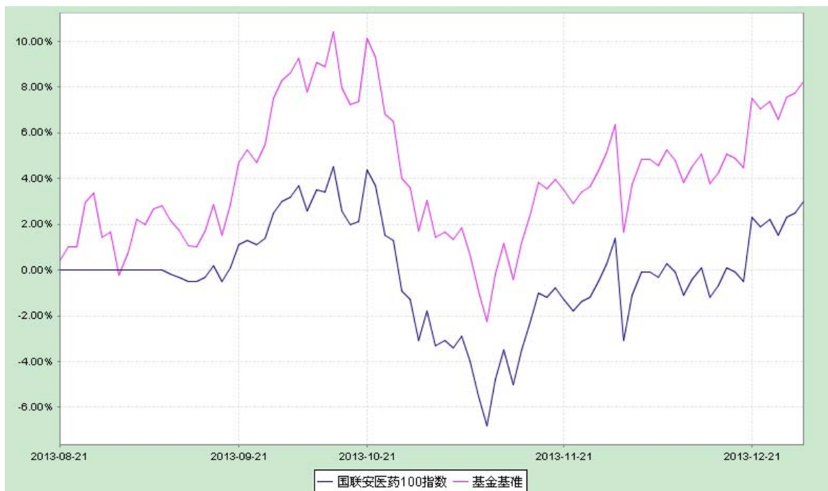
国联安中证医药 100 指数证券投资基金 份额累计净值增长率及同期业绩比较基准收益率历史走势对比图 (2013 年 8 月 21 日至 2013 年 12 月 31 日)

注：1、本基金业绩比较基准为： 95\% \times 中证医药 100 指数收益率 + 5\% \times 活期存款利率（税后）；