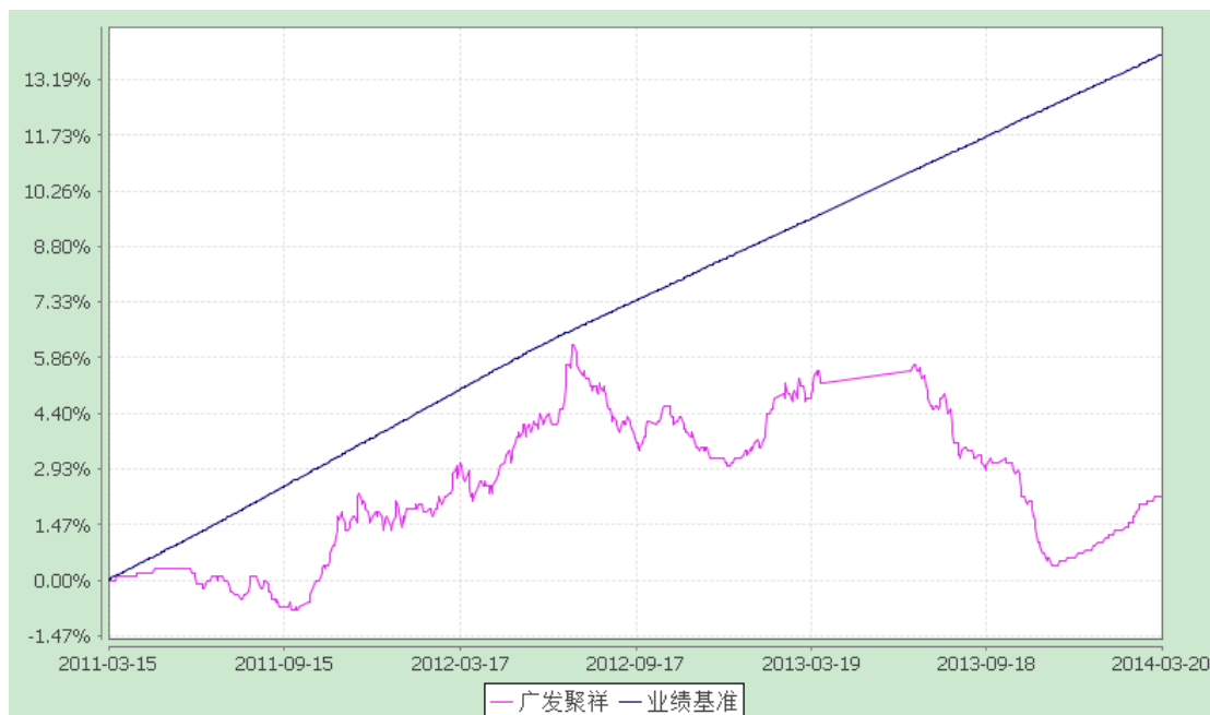
广发聚祥保本混合型证券投资基金 累计净值增长率与业绩比较基准收益率历史走势对比图 (2011年3月15日至2014年3月21日)

注:本基金建仓期为基金合同生效后6个月,建仓期结束时各项资产配置比例符合本基金合同有关规定。