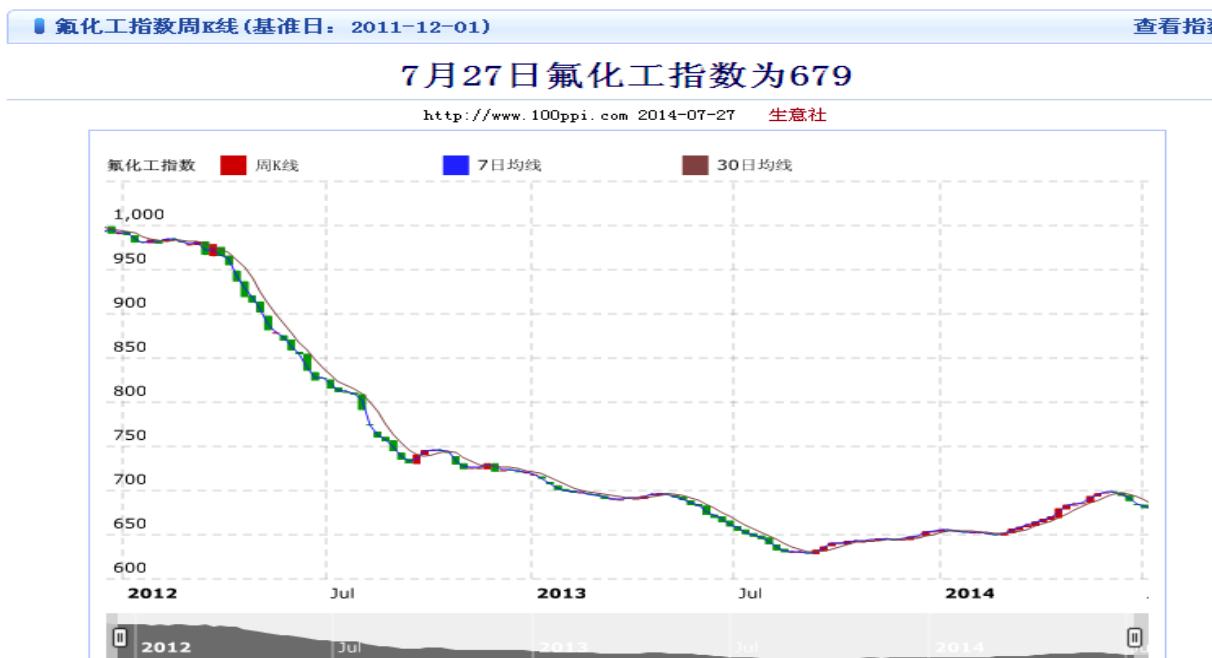
核心业务氟化工指数走势图

报告期，国内生产总值（GDP）增速与工业品出厂价格指数（PPI）比上年同期（以下简称“同比”）继续下降；公司所处化工行业供大于求矛盾突出，市场整体疲弱，公司产品与原料价格同比继续下跌。