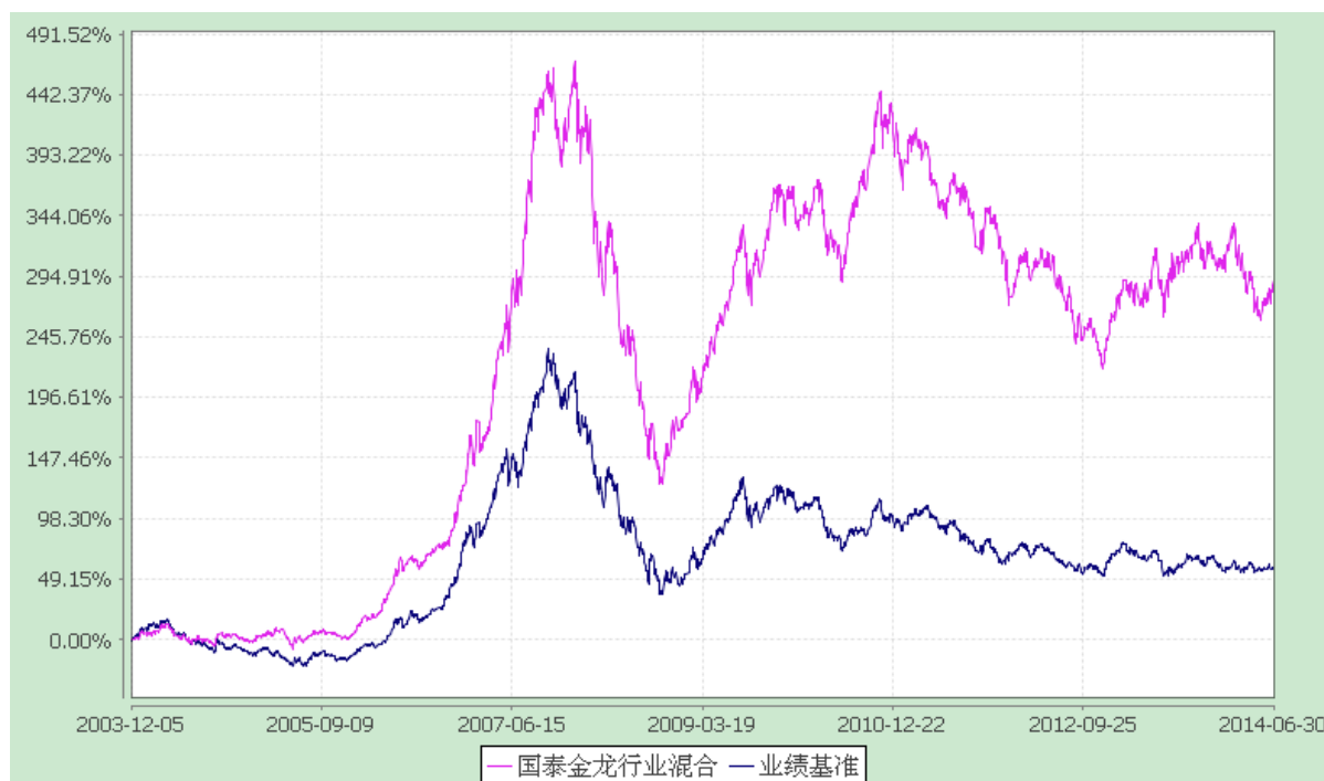
份额累计净值增长率与业绩比较基准收益率历史走势对比图 (2003 年 12 月 5 日至 2014 年 6 月 30 日)

注：本基金的合同生效日为 2003 年 12 月 5 日。本基金在六个月建仓期结束时，各项资产配置比例符合合同约定。