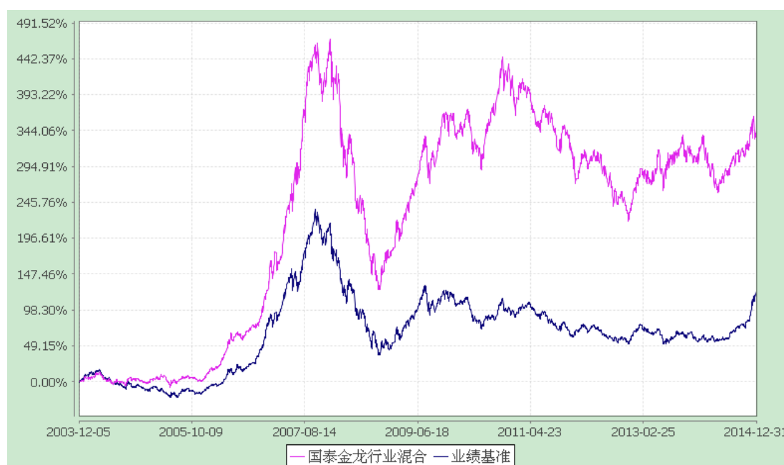
国泰金龙行业精选证券投资基金 累计净值增长率与业绩比较基准收益率的历史走势对比图 (2003 年 12 月 5 日至 2014 年 12 月 31 日)

注：本基金的合同生效日为2003年12月5日。本基金在六个月建仓期结束时，各项资产配置比例符合合同约定。