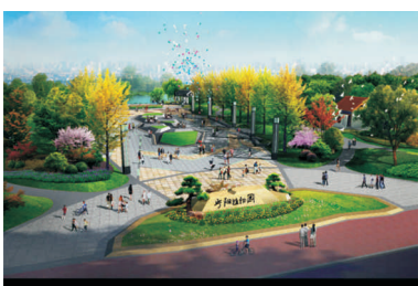
● 图为 宁阳植物园获奖证书及景观设计效果图