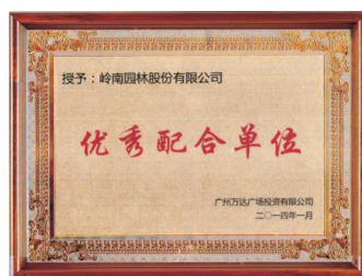
• 图为公司获广州万达颁发的“优秀配合单位”