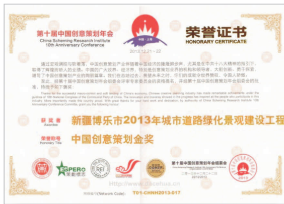
• 图为 中国著名园林景观创意领军团队荣誉证书