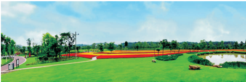
● 图为 自贡釜溪河复合绿道（示范段）工程项目获奖牌匾及项目实景