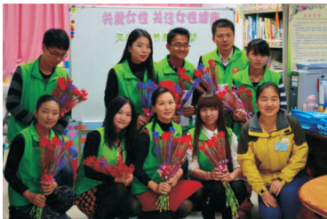
• 图为 岭南志愿者三八妇女节前往医院看望生病女患者

公司内部设立的“岭南园林志愿服务队”“爱心基金”及“一元梦想基金”，形成了岭南“人人心中都有爱、人人都愿献出爱”的人文环境。