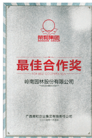
• 图为公司获荣和集团颁发的“最佳合作奖”