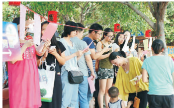
• 中秋游园烧烤活动