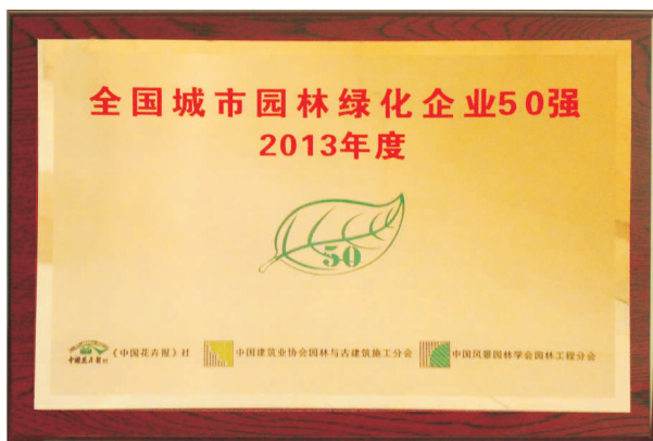
• 图为 2013年度全国城市园林绿化企业50强奖牌