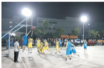
• 员工年度篮球比赛