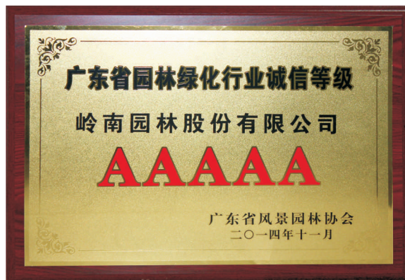
• 图为 广东省园林绿化行业5A诚信企业奖牌