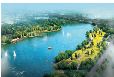
● 图为 虎门港穗丰年河道滨海获奖证书及景观设计效果图