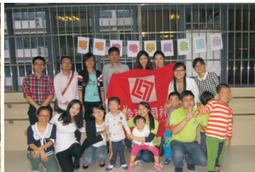
• 图为 岭南志愿者与东莞市特殊儿童学前教育中心联合举办生日联欢会