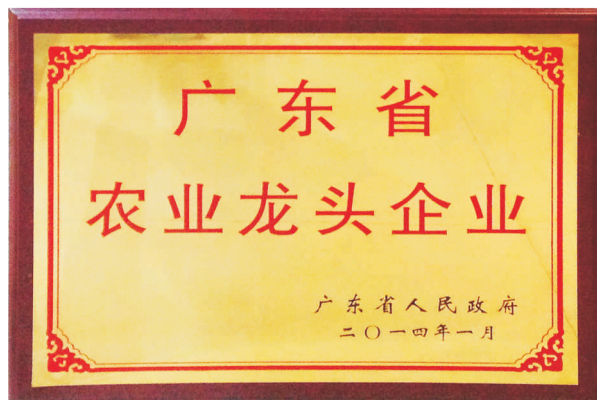
• 图为 广东省农业龙头企业奖牌