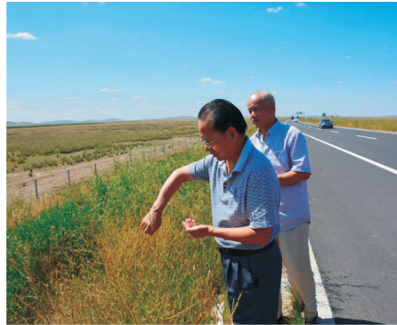
• 图为 公司园科院赴内蒙古考察学习草原沙化治理