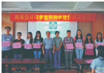
• 图为 在华南农业大学举行岭南园林助学金和科研经费资助颁发仪式