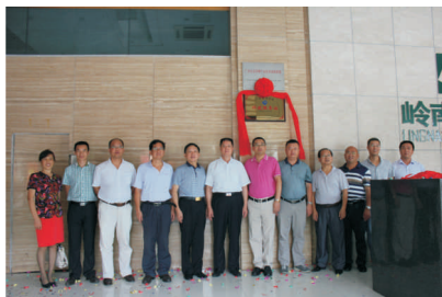
• 图为 广东园林学会“科技服务站”揭牌仪式在公司总部举行