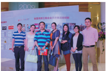
• 图为 公司参加东莞浙江商会“慈心东莞善行天下”活动