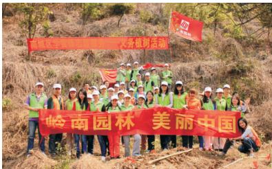
• 图为 岭南志愿者参加义务植树活动