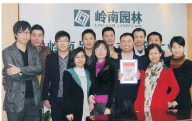
• 图为 岭南一元梦想基金发起部门合影