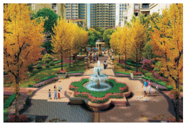
● 图为 重庆英利狮城花园获奖证书及景观设计效果图