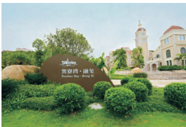
● 图为 金融街南区融玺一期项目获奖牌匾及项目实景