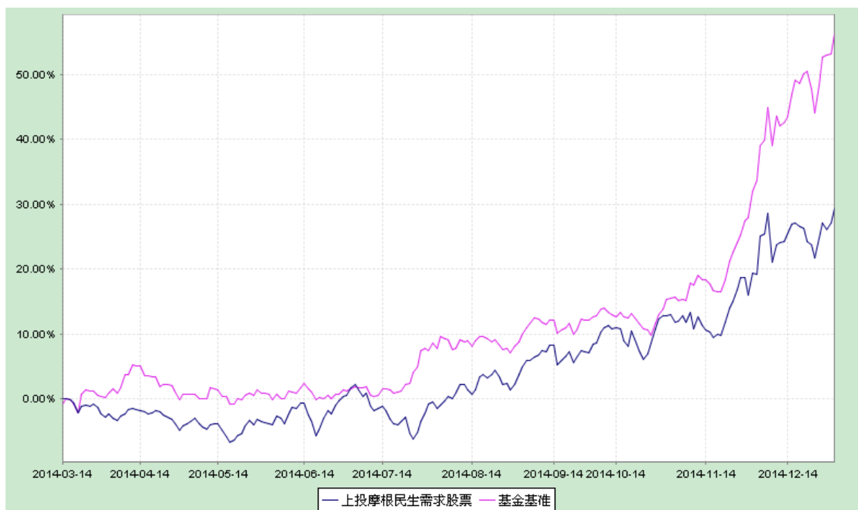
上投摩根民生需求股票型证券投资基金 份额累计净值增长率与业绩比较基准收益率历史走势对比图 (2014 年 3 月 14 日至 2014 年 12 月 31 日)

注：本基金合同生效日为 2014 年 3 月 14 日，截至报告期末本基金合同生效未满一年，图示时间段为 2014 年 3 月 14 日至 2014 年 12 月 31 日。本基金建仓期自 2014 年 3 月 14 日至 2014 年 9 月 12 日，建仓期结束时资产配置比例符合本基金基金合同规定。