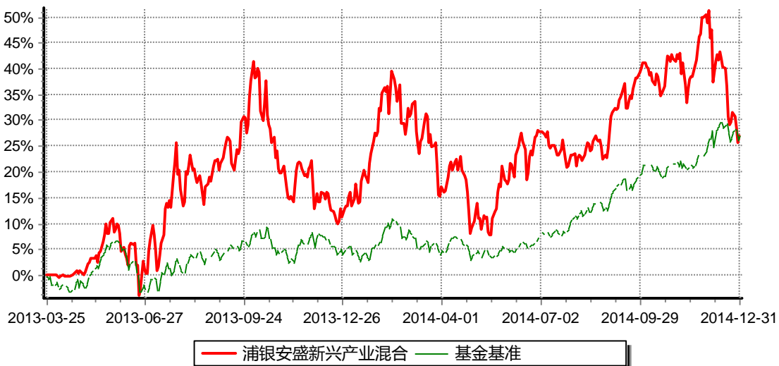
浦银安盛战略新兴产业混合型证券投资基金 份额累计净值增长率与业绩比较基准收益率历史走势对比图 （2013年3月25日-2014年12月31日）