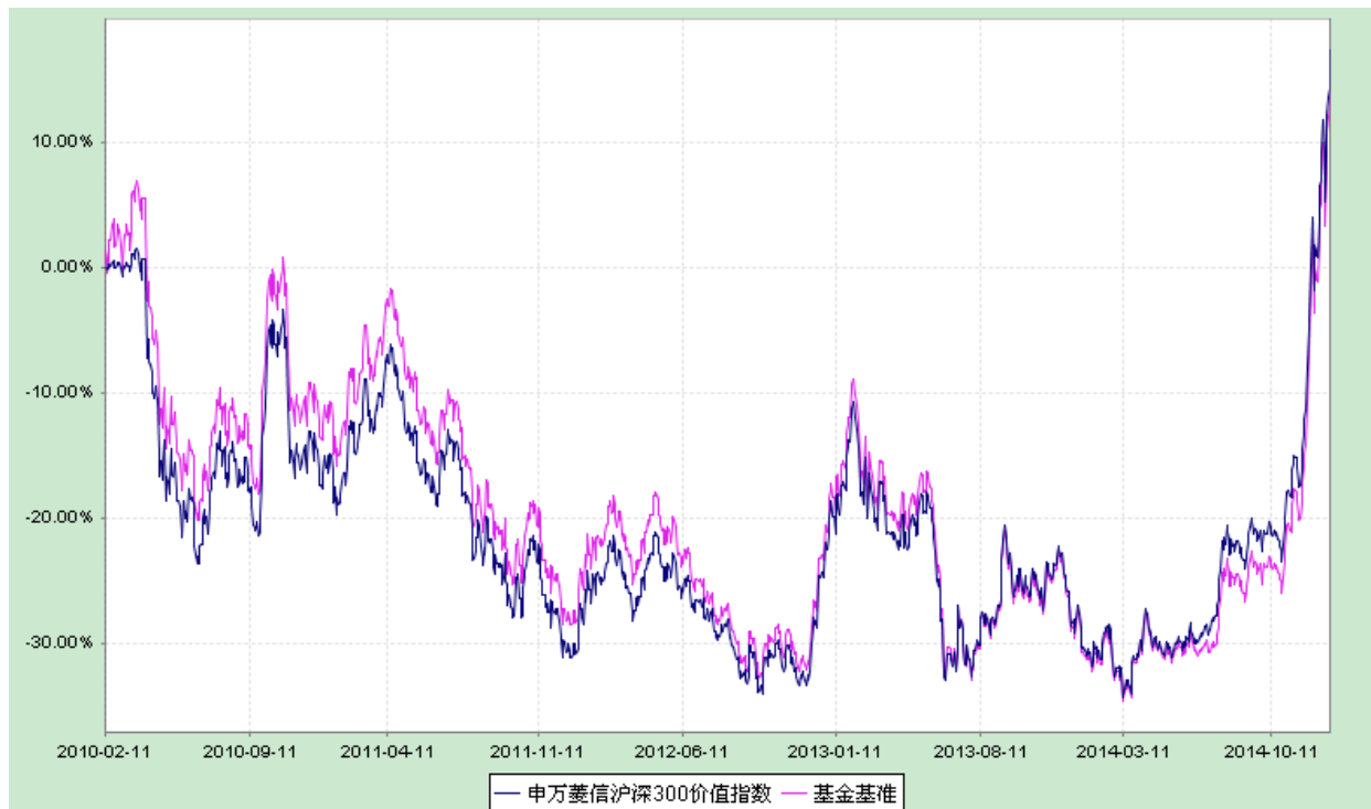
申万菱信沪深 300 价值指数证券投资基金 份额累计净值增长率与业绩比较基准收益率历史走势对比图 （2010 年 2 月 11 日至 2014 年 12 月 31 日）