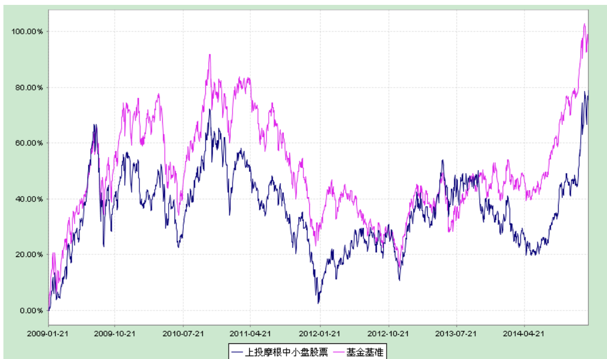
上投摩根中小盘股票型证券投资基金 份额累计净值增长率与业绩比较基准收益率历史走势对比图 (2009年1月21日至2014年12月31日)

注：1. 本基金建仓期自2009年1月21日至2009年7月20日，建仓期结束时资产配置比例符合本基金基金合同规定。