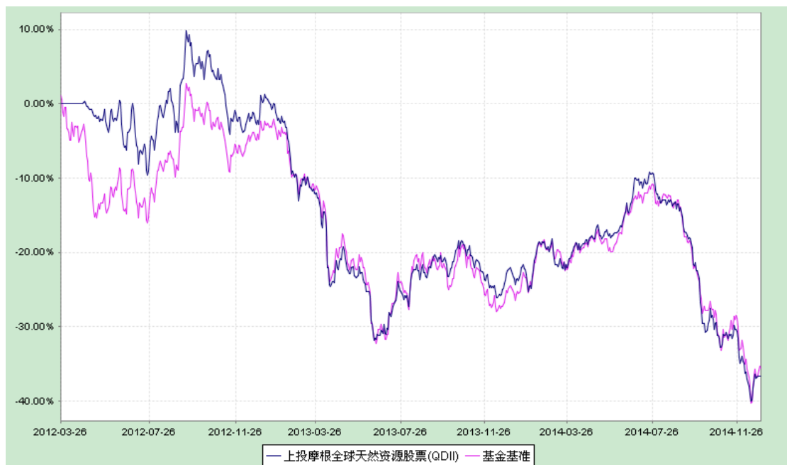
上投摩根全球天然资源股票型证券投资基金 份额累计净值增长率与业绩比较基准收益率历史走势对比图 （2012年3月26日至2014年12月31日）

注：1. 本基金合同生效日为2012年3月26日，图示时间段为2012年3月26日至2014年12月31日。