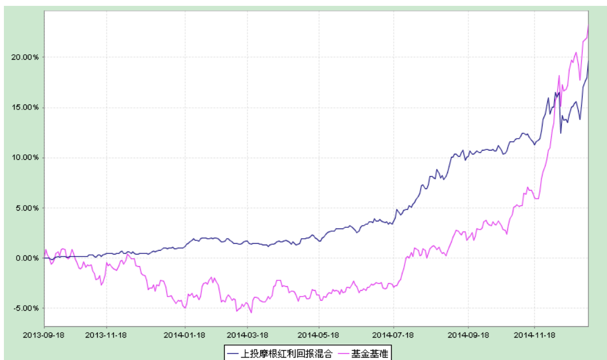
上投摩根红利回报混合型证券投资基金 份额累计净值增长率与业绩比较基准收益率历史走势对比图 (2013 年 9 月 18 日至 2014 年 12 月 31 日)

注：本基金建仓期自 2013 年 9 月 18 日至 2014 年 3 月 17 日。建仓期结束时资产配置比例符合本基金基金合同规定。