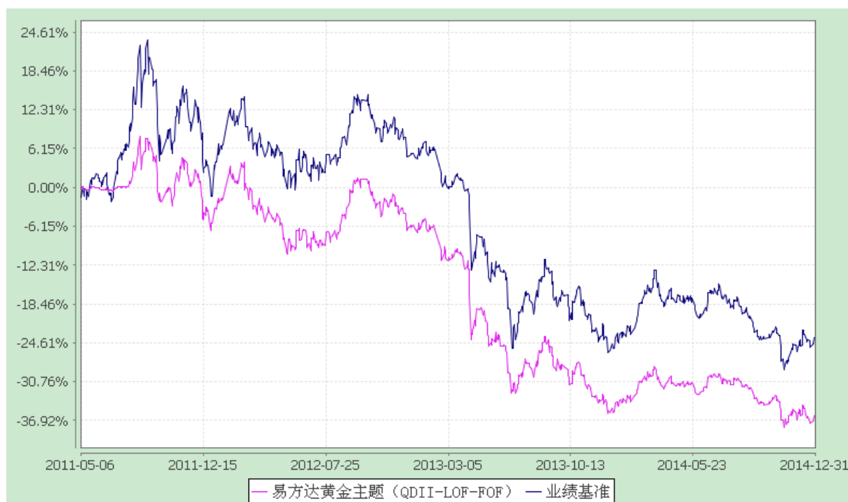
易方达黄金主题证券投资基金（LOF） 份额累计净值增长率与业绩比较基准收益率历史走势对比图 （2011年5月6日至2014年12月31日）