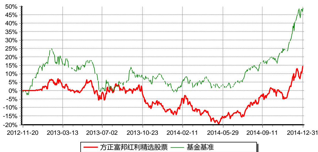
方正富邦红利精选股票型证券投资基金 份额累计净值增长率与业绩比较基准收益率历史走势对比图 （2012年11月20日-2014年12月31日）

注：1、本基金合同于2012年11月20日生效。 2、本基金的建仓期为2012年11月20日至2013年5月19日，建仓期结束时，本基金的各项投资组合比例符合基金合同约定。