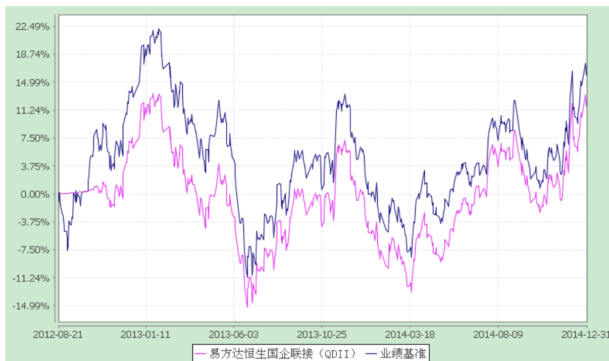
易方达恒生中国企业交易型开放式指数证券投资基金联接基金 份额累计净值增长率与业绩比较基准收益率历史走势对比图 (2012年8月21日至2014年12月31日)