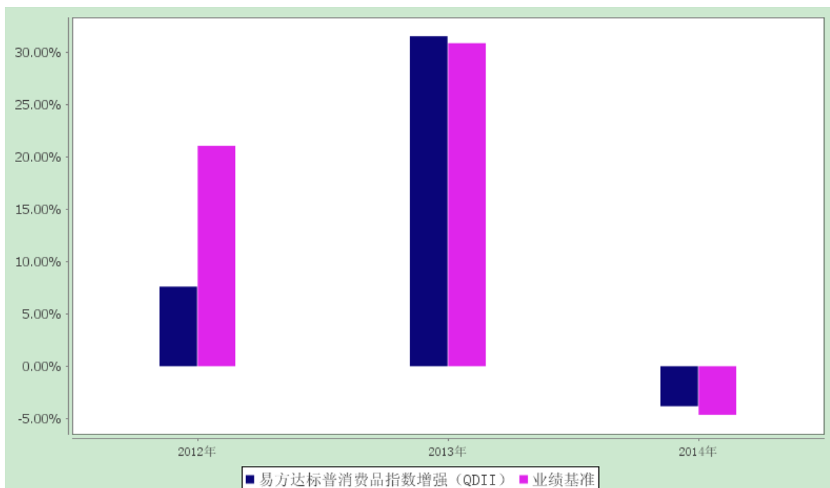
易方达标普全球高端消费品指数增强型证券投资基金 自基金合同生效以来基金净值增长率与业绩比较基准历年收益率对比图