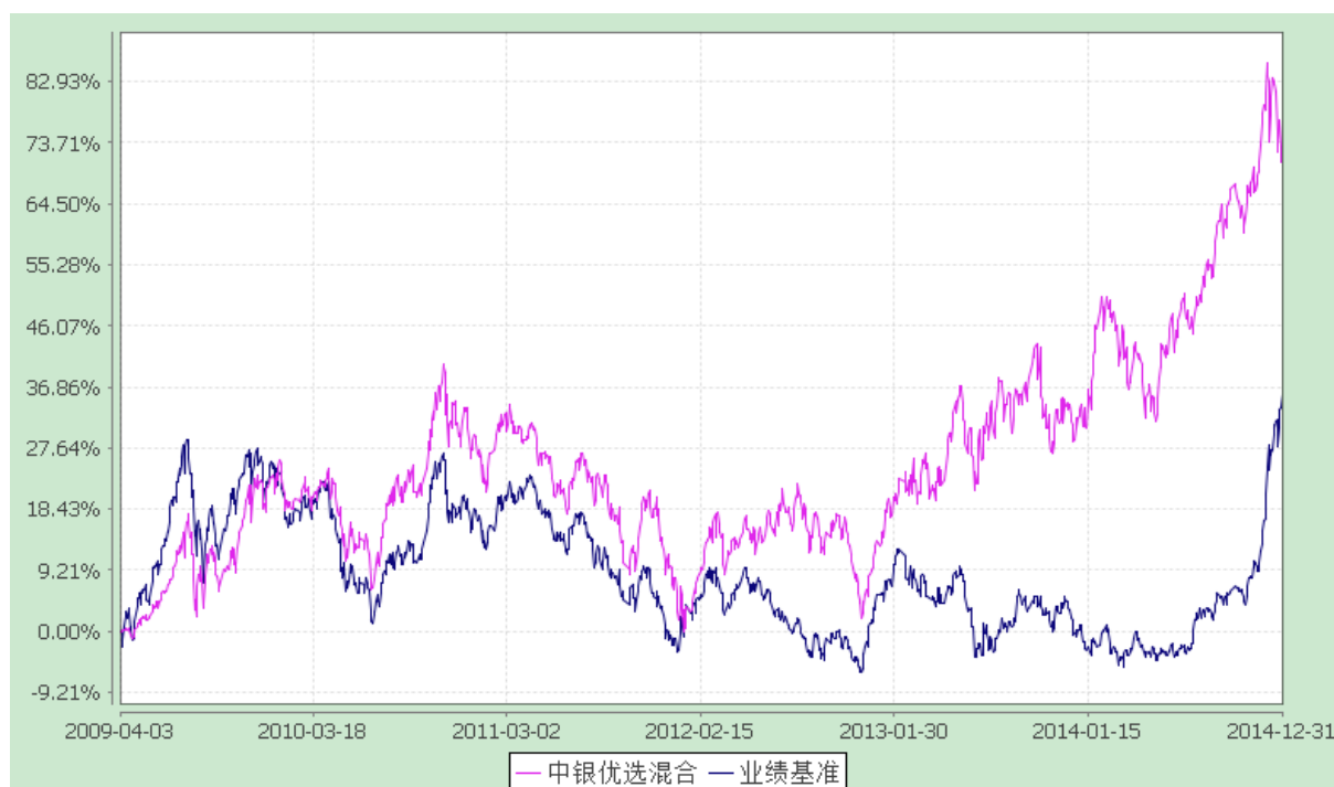
中银行业优选灵活配置混合型证券投资基金 份额累计净值增长率与业绩比较基准收益率的历史走势对比图 (2009 年 4 月 3 日至 2014 年 12 月 31 日)

注：按基金合同规定，本基金自基金合同生效起 6 个月内为建仓期，截至建仓结束时本基金的各项投资比例已达到基金合同第十一部分（二）的规定，即本基金投资组合中，股票投资的比例范围为基金资产的 30%—80%；债券、权证、资产支持证券、货币市场工具及国家证券监管机构允许基金投资的其他金融工具占基金资产的比例范围为 20—70%；其中现金或者到期日在一年以内的政府债券不低于基金资产净值的 5%，持有权证的市场不超过基金资产净值的 3%。对于中国证监会允许投资创新金融产品，将依据有关法律法规进行投资管理。