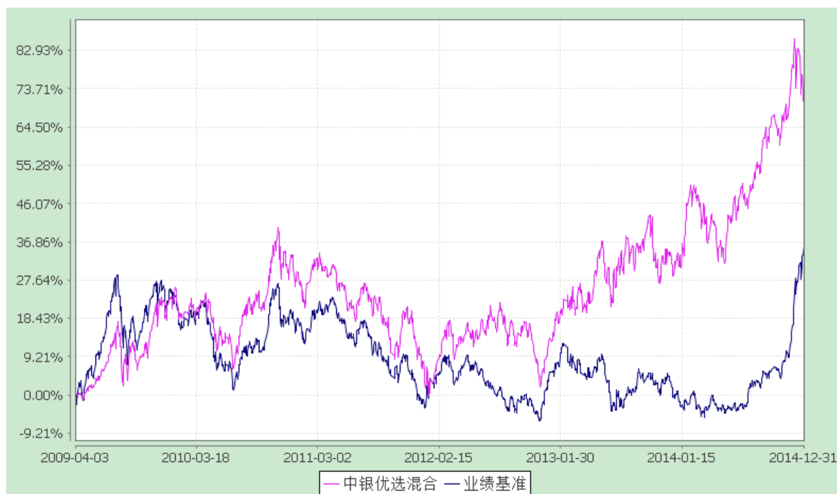
中银行业优选灵活配置混合型证券投资基金 份额累计净值增长率与业绩比较基准收益率的历史走势对比图 (2009 年 4 月 3 日至 2014 年 12 月 31 日)

注：按基金合同规定，本基金自基金合同生效起6个月内为建仓期，截至建仓结束时本基金的各项投资比例已达到基金合同第十一部分（二）的规定，即本基金投资组合中，股票投资的比例范围为基金资产的30%—80%；债券、权证、资产支持证券、货币市场工具及国家证券监管机构允许基金投资的其他金融工具占基金资产的比例范围为20—70%；其中现金或者到期日在一年以内的政府债券不低于基金资产净值的5%，持有权证的市场价值不超过基金资产净值的3%。对于中国证监会允许投资的创