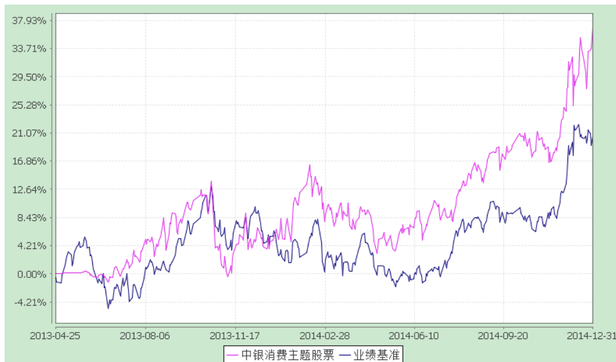
中银消费主题股票型证券投资基金 份额累计净值增长率与业绩比较基准收益率的历史走势对比图 (2013 年 4 月 25 日至 2014 年 12 月 31 日)

注：按基金合同规定，本基金自基金合同生效起 6 个月内为建仓期，截至建仓结束时本基金的各项投资比例已达到基金合同第十二部分（三）的规定，即本基金投资组合中股票资产占基金资产的 60%-95%，其中投资于本基金定义的大消费行业的股票不低于股票资产的 80%，权证投资占基金资产净值的 0%-3%，现金、债券、货币市场工具以及中国证监会允许基金投资的其他金融工具占基金资产的 5%-40%，其中，基金保留的现金或者投资于到期日在一年以内的政府债券的比例合计不低于基金资产净值的 5%。