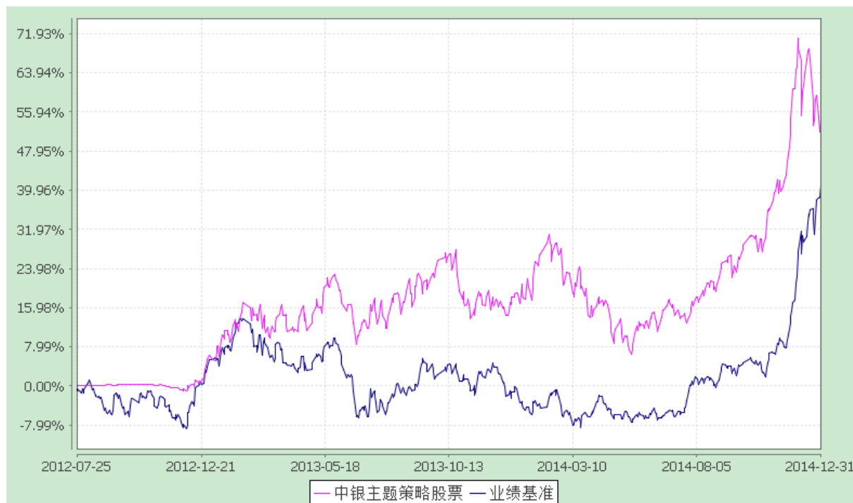
份额累计净值增长率与业绩比较基准收益率的历史走势对比图 (2012 年 7 月 25 日至 2014 年 12 月 31 日)

注：按基金合同规定，本基金自基金合同生效起 6 个月内为建仓期，截至建仓结束时本基金的各项投资比例已达到基金合同第十二部分（二）的规定，即本基金投资组合中，股票资产占基金资产的 60%-95%，权证投资占基金资产净值的 0%-3%，现金、债券、货币市场工具以及中国证监会允许基金投资的其他金融工具占基金资产的 5%-40%，其中，基金保留的现金或者投资于到期日在一年以内的政府债券的比例合计不低于基金资产净值的 5%。