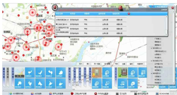
图5 PWK工作平台示意图

(3)整体解决方案方面：智慧燃气PWK全国服务平台(如图5)取得重大突破，可以看到GIS平台上覆盖项目所有监测信息，随时查看监测探点是否需要维护等，系统解决方案的领先优势显著；燃气巡检领域另一重磅产品为“车载激光甲烷巡检仪”(如图6)，产品由前置泵吸巡检仪、顶置遥测仪、车内控制器和远程监控中心构成，前置泵吸巡检仪和顶置遥测仪均是采用激光光谱分析原理，内置了多次反射腔体，有效增加了测量光程，灵敏度达到了0.1ppm，能够高速准确地检测道路燃气管网的泄漏情况，顶置遥测仪采用光学遥测法，可快速检测道路两旁30米内人员无法到达的地方，车内控制器可以显示检测画面和浓度信息，结合GPS技术可实现漏点定位，同时把巡检信息上传至远程监控中心。