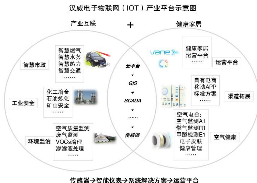
图1 汉威电子物联网（IOT）产业平台示意图

公司以先进感知技术为核心和基础，持续升级传感器、智能仪表、系统平台应用等产品与服务体系，以“产业互联+健康家居”为产业布局思路，以有序的外延并购补全补强产业链条，业务布局涵盖智慧市政、工业安全、环保监治、居家健康等四大业务领域，实现了从单纯的电子硬件企业向“1平台+N行业应用”平台的跃迁，公司已成功转型为领先的平台型物联网（IOT）解决方案提供商（如下图1）。