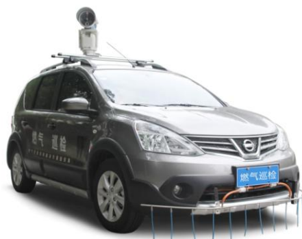
图6 车载激光甲烷巡检仪”