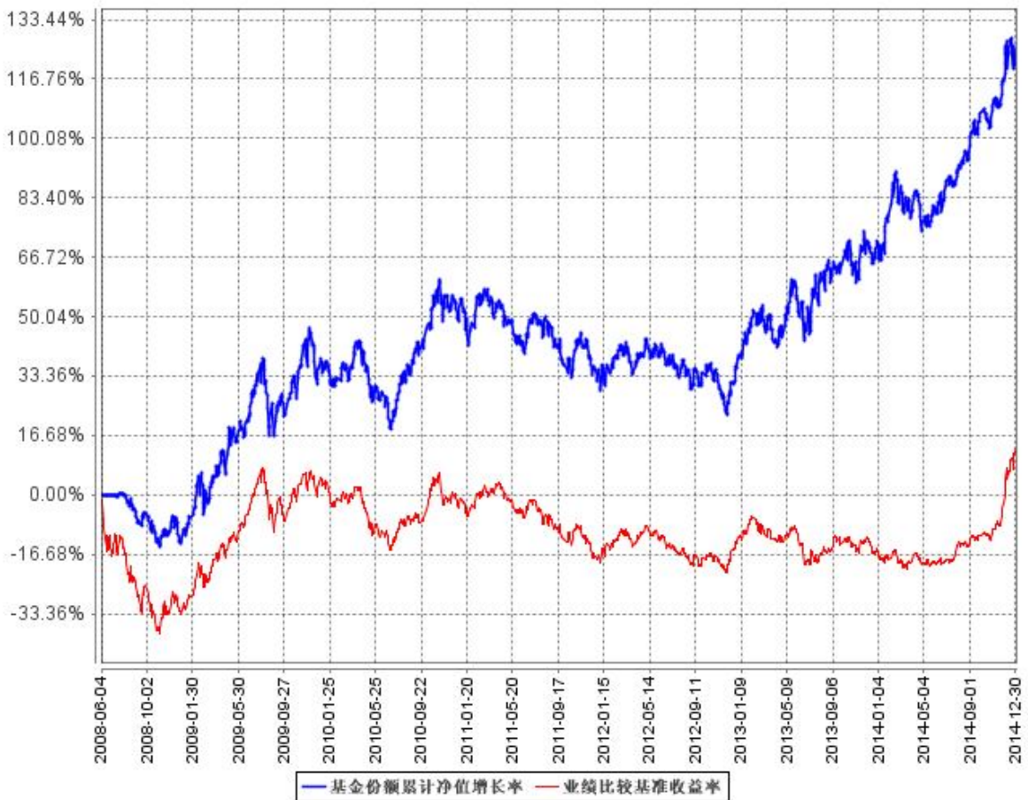
基金份额累计净值增长率与同期业绩比较基准收益率的历史走势对比图