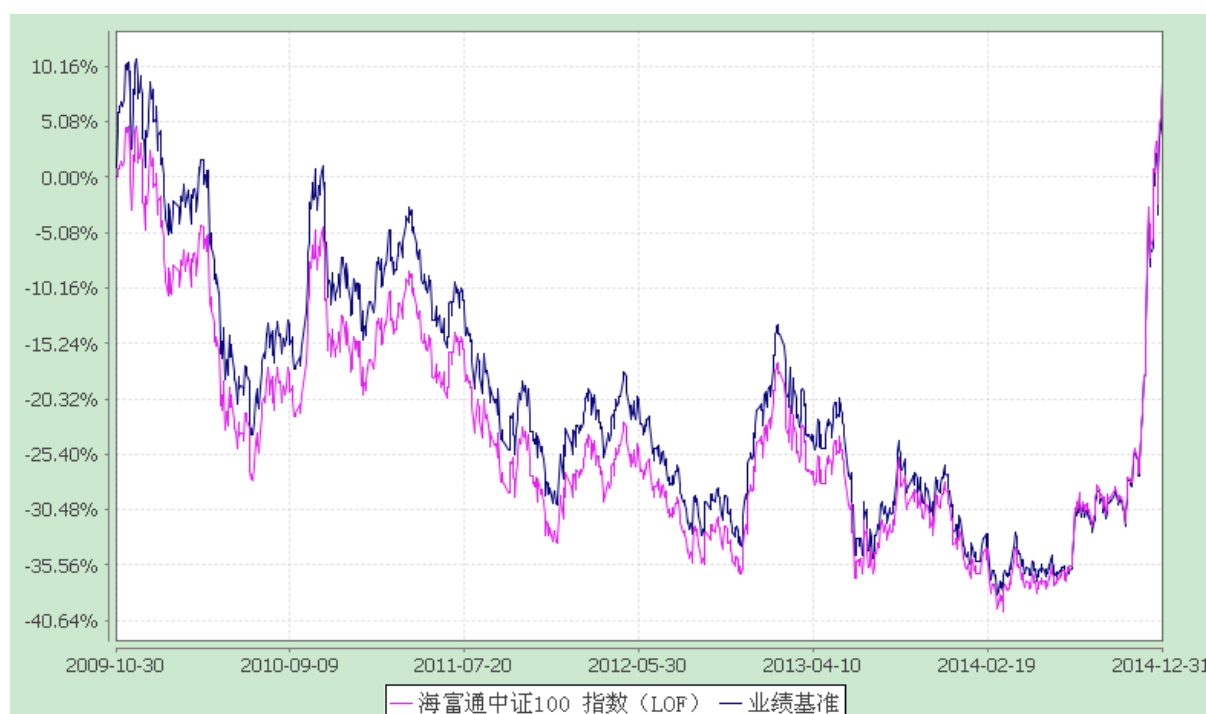
海富通中证 100 指数证券投资基金 (LOF) 份额累计净值增长率与业绩比较基准收益率的历史走势对比图 (2009 年 10 月 30 日至 2014 年 12 月 31 日)

注: 按照本基金合同规定, 本基金建仓期为基金合同生效之日起六个月。建仓期满至今, 本基金投资组合均达到本基金合同第十五条 (二)、(七) 规定的比例限制及本基金投资组合的比例范围。