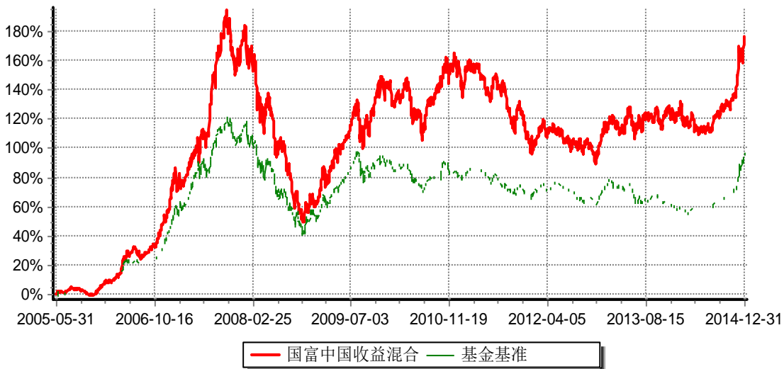
富兰克林国海中国收益证券投资基金 份额累计净值增长率与业绩比较基准收益率历史走势对比图 (2005年6月1日-2014年12月31日)

注：本基金的基金合同生效日为2005年6月1日。本基金在6个月建仓期结束时，各项投资比例符合基金合同约定。