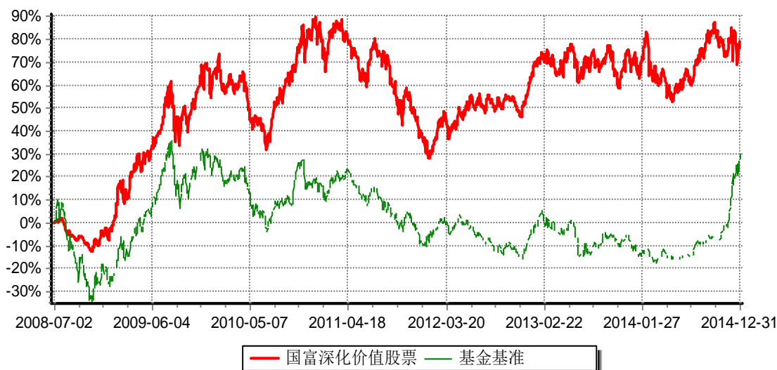
富兰克林国海深化价值股票型证券投资基金 份额累计净值增长率与业绩比较基准收益率历史走势对比图 （2008年7月3日-2014年12月31日）