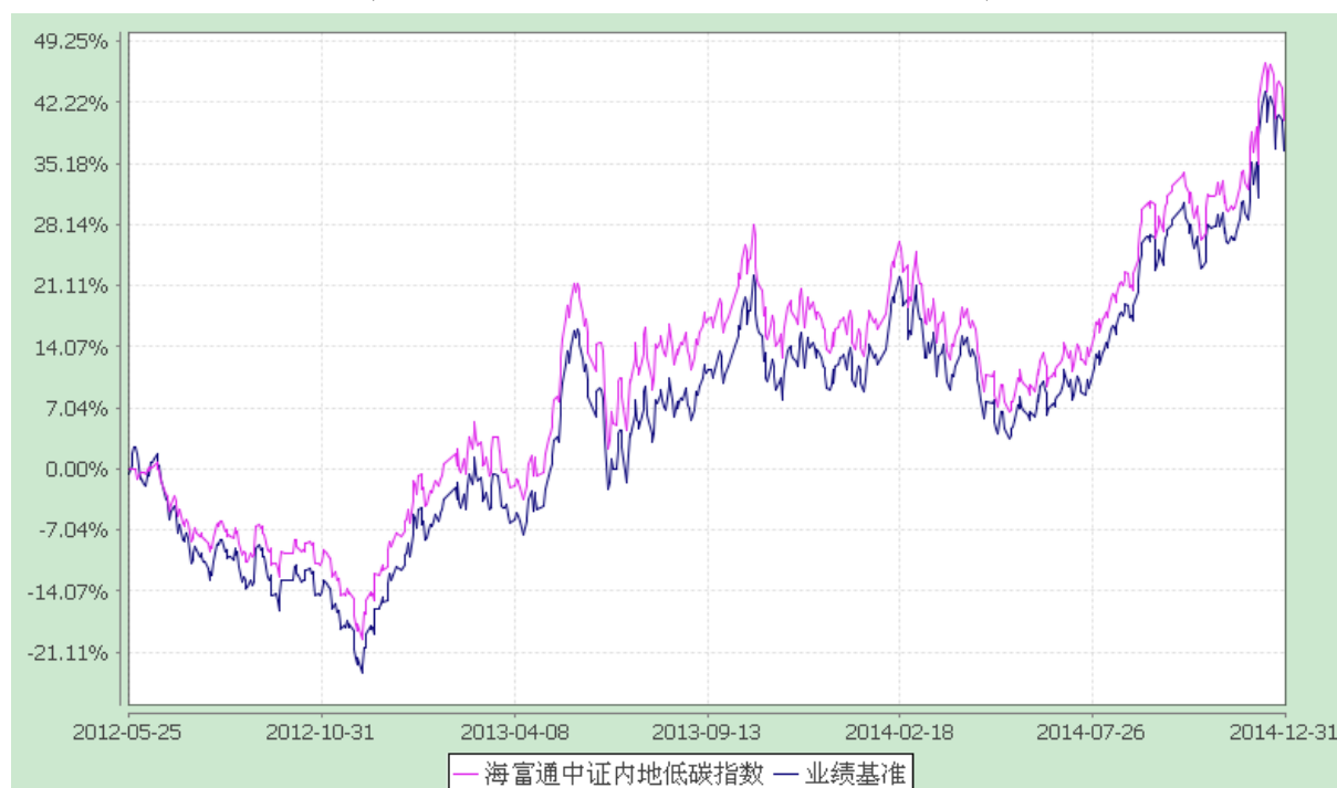
海富通中证内地低碳经济主题指数证券投资基金 份额累计净值增长率与业绩比较基准收益率的历史走势对比图 (2012 年 5 月 25 日至 2014 年 12 月 31 日)