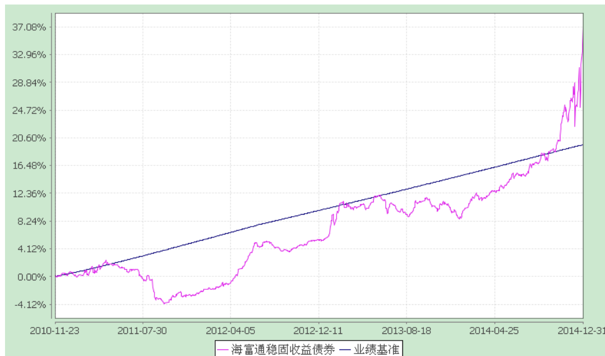
海富通稳固收益债券型证券投资基金 份额累计净值增长率与业绩比较基准收益率的历史走势对比图 (2010年11月23日至2014年12月31日)

注：按照本基金合同规定，本基金建仓期为基金合同生效之日起六个月。截至报告期末本基金的各项投资比例已达到基金合同第十一部分（二）投资范围、（五）投资限制中规定的各项比例。