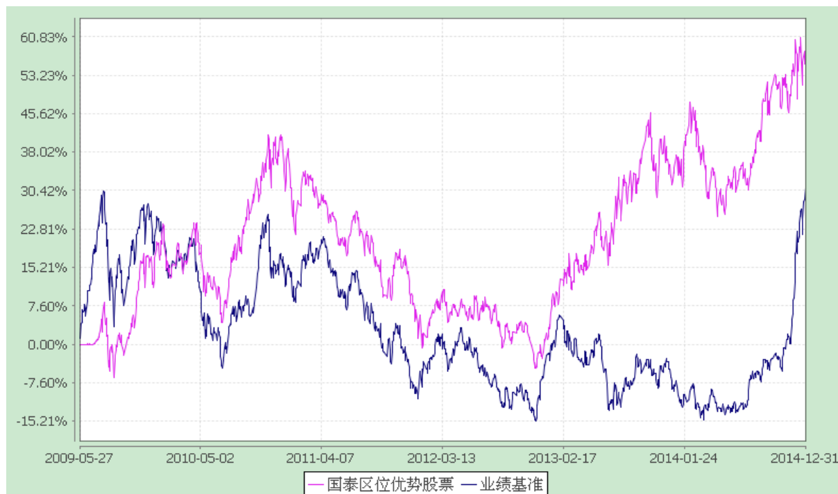
自基金合同生效以来份额累计净值增长率与业绩比较基准收益率的历史走势对比图 (2009 年 5 月 27 日至 2014 年 12 月 31 日)

注：本基金的合同生效日为 2009 年 5 月 27 日。本基金在六个月建仓期结束时，各项资产配置比例符合合同约定。