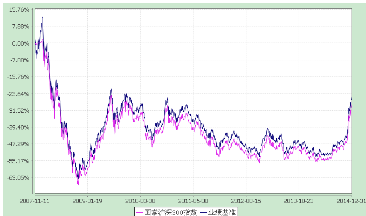
自基金合同生效以来份额累计净值增长率与业绩比较基准收益率的历史走势对比图 (2007 年 11 月 11 日至 2014 年 12 月 31 日)

注：本基金的合同生效日为 2007 年 11 月 11 日，本基金在六个月建仓期结束时，各项资产配置比例符合合同约定。