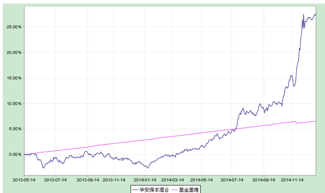
华安保本混合型证券投资基金 份额累计净值增长率与业绩比较基准收益率历史走势对比图 (2013 年 5 月 14 日至 2014 年 12 月 31 日)