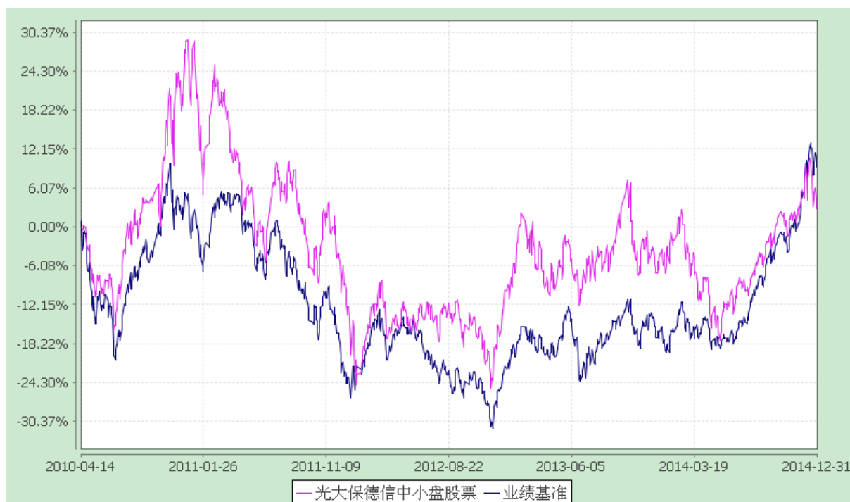
光大保德信中小盘股票型证券投资基金 份额累计净值增长率与业绩比较基准收益率的历史走势对比图 (2010 年 4 月 14 日至 2014 年 12 月 31 日)

注：根据基金合同的规定，本基金建仓期为 2010 年 4 月 14 日至 2010 年 10 月 13 日。建仓期结束时本基金各项资产配置比例符合本基金合同规定的比例限制及投资组合的比例范围。