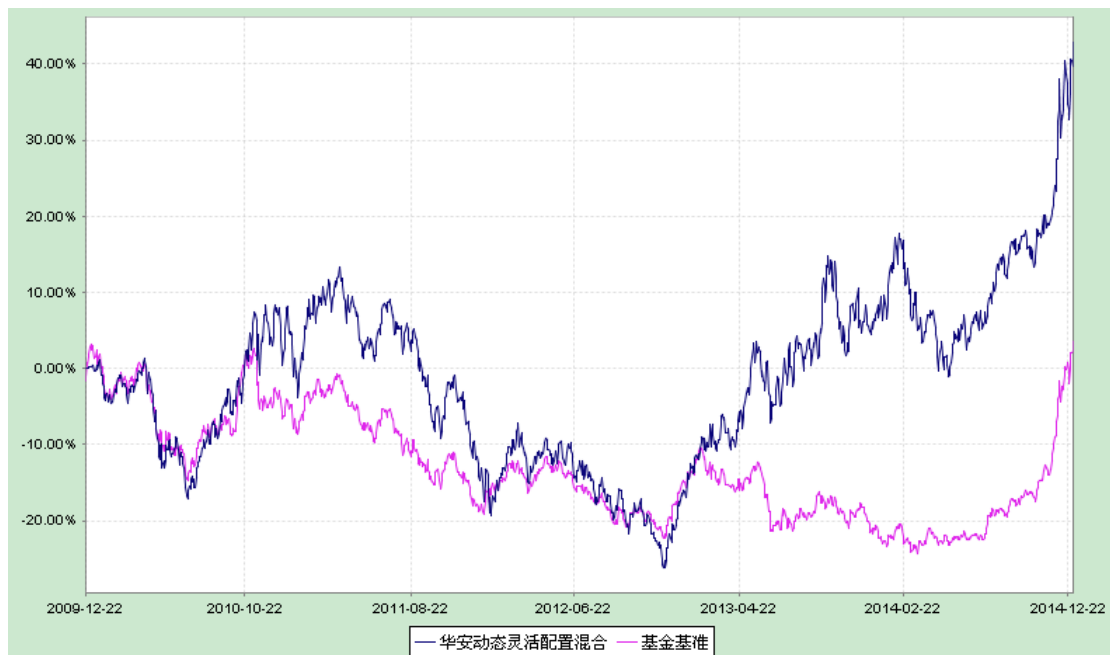
华安动态灵活配置混合型证券投资基金 份额累计净值增长率与业绩比较基准收益率历史走势对比图 (2009 年 12 月 22 日至 2014 年 12 月 31 日)