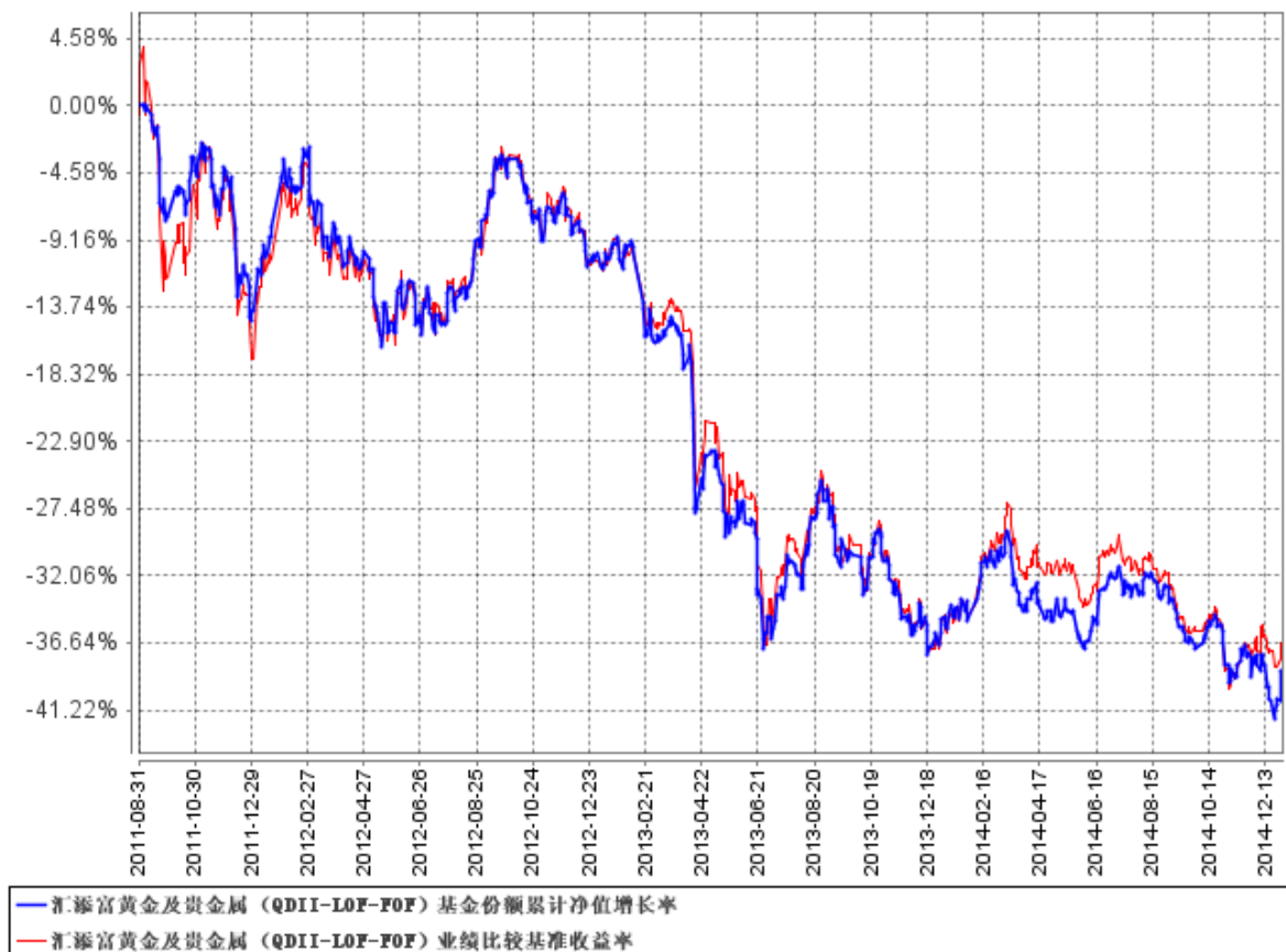
汇添富黄金及贵金属（QDII-LOF-FOF）基金份额累计净值增长率与同期业绩比较基准收益率的历史走势对比图

注：本基金建仓期为本《基金合同》生效之日（2011 年 8 月 31 日）起 6 个月，建仓期结束时各项资产配置比例符合合同规定。