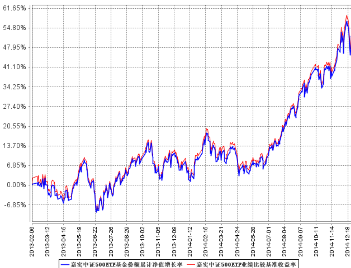
图：嘉实中证 500ETF 基金份额累计净值增长率与同期业绩比较基准收益率的历史走势对比图