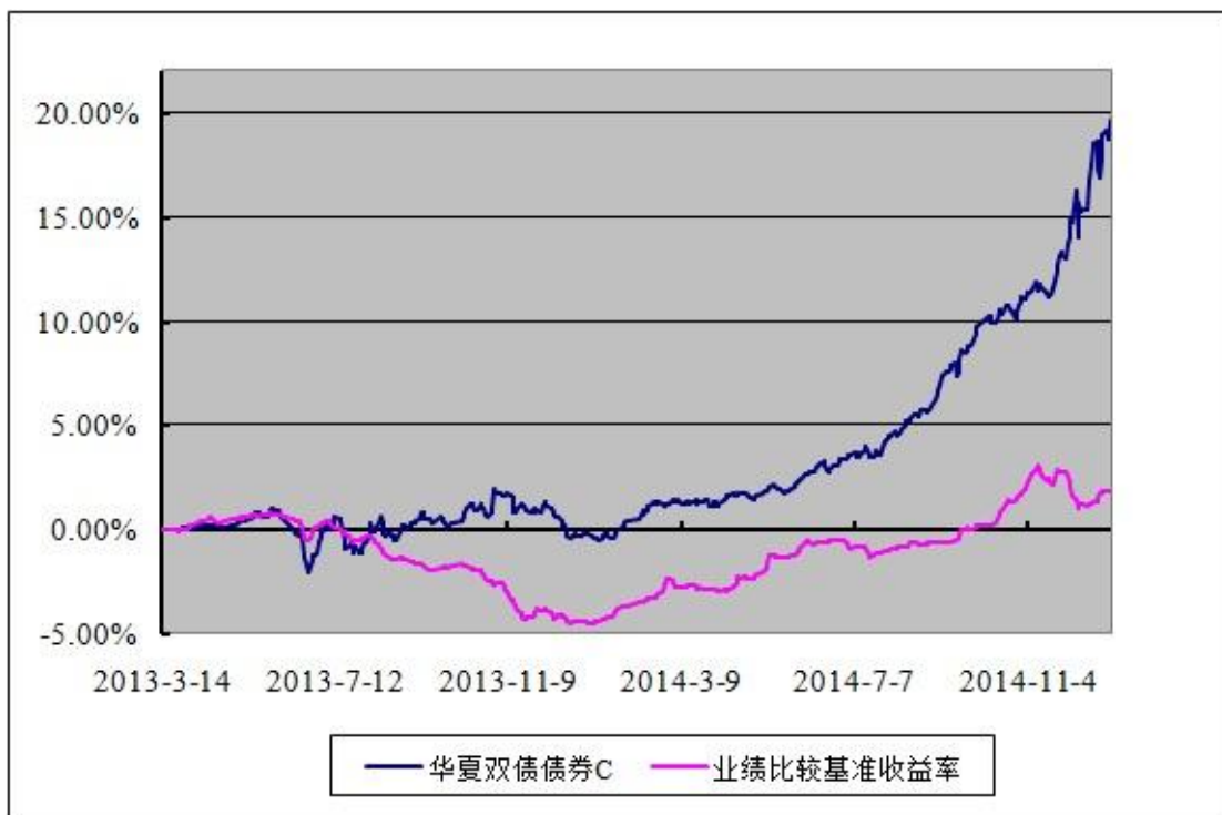
3.2.3 自基金合同生效以来基金每年净值增长率及其与同期业绩比较基准收益率的比较