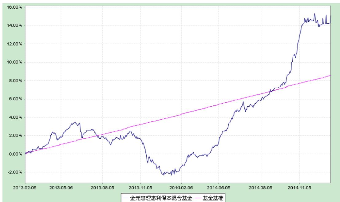
金元惠理惠利保本混合型证券投资基金 转型前累计净值增长率历史走势图 (2013 年 2 月 5 日至 2015 年 1 月 13 日)