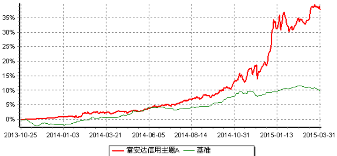
本基金A类累计净值增长率与业绩比较基准收益率的历史走势对比图 (2013年10月25日-2015年03月31日)