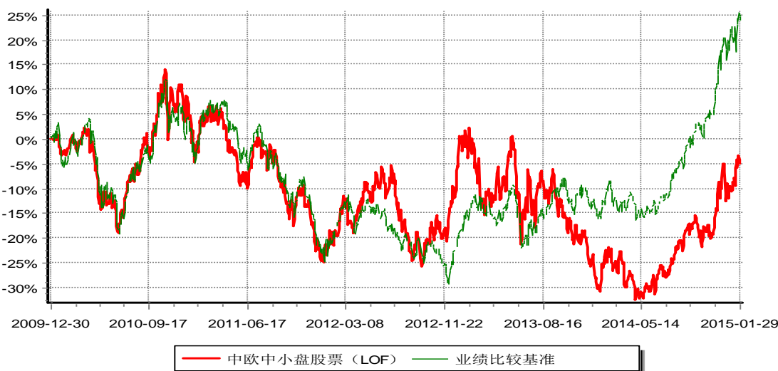
中欧中小盘股票型证券投资基金（LOF） 份额累计净值增长率与业绩比较基准收益率历史走势对比图 (2009年12月30日-2015年01月29日)