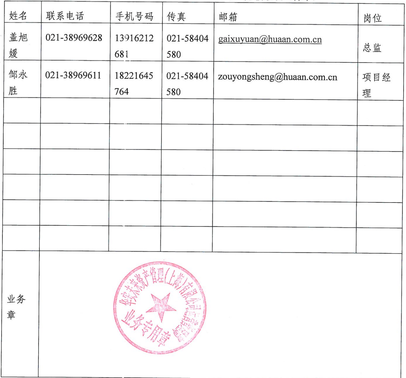
华安未来资产管理(上海)有限公司业务联系表(样本)