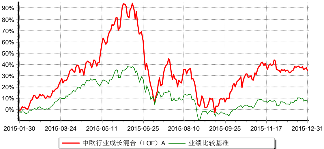
中欧行业成长混合型证券投资基金(LOF) 累计份额净值增长率与业绩比较基准收益率历史走势对比图 (2015年1月30日-2015年12月31日)

注：本基金转型日期为2015年1月30日。截止报告期末，本基金转型后基金合同生效未满一年。按基金合同的规定。本基金自基金合同生效日起六个月为建仓期，建仓期结束时本基金的各项资产配置比例已达到基金合同的规定。