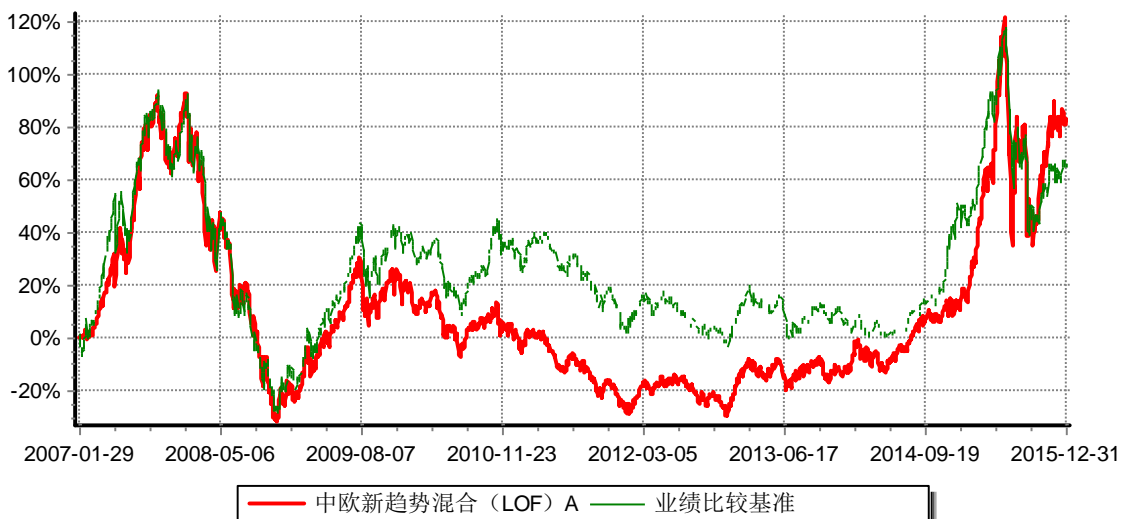
中欧新趋势混合型证券投资基金A（LOF） 累计份额净值增长率与业绩比较基准收益率历史走势对比图 （2007年1月29日-2015年12月31日）