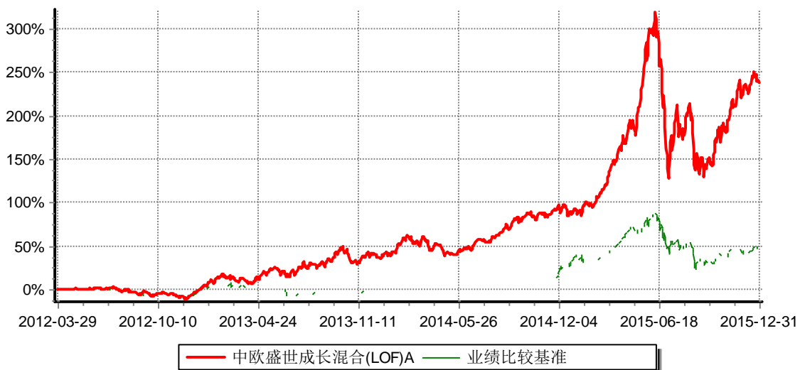
中欧盛世成长混合型证券投资基金A (LOF) 累计份额净值增长率与业绩比较基准收益率历史走势对比图 (2012年3月29日-2015年12月31日)