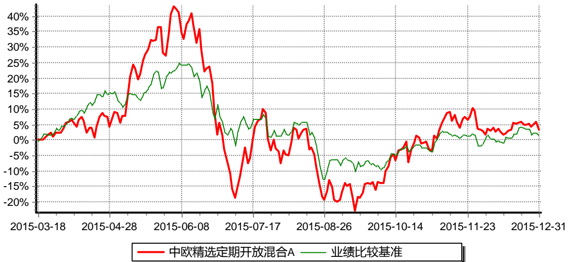
中欧精选定期开放混合A 基金累计净值增长率与业绩比较基准收益率历史走势对比图 (2015年03月18日-2015年12月31日)

注：本基金基金合同生效日期为2015年3月18日，自基金合同生效日起到本报告期末不满一年，按基金合同的规定，本基金自基金合同生效起六个月为建仓期，建仓期结束时本基金的各项资产配置比例已达到基金合同的规定。