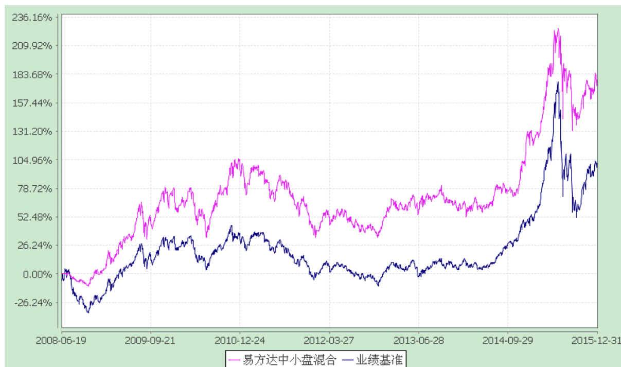
易方达中小盘混合型证券投资基金 份额累计净值增长率与业绩比较基准收益率历史走势对比图 (2008年6月19日至2015年12月31日)

注：自基金合同生效至报告期末，基金份额净值增长率为 176.53%，同期业绩比较基准收益率为 98.76%。