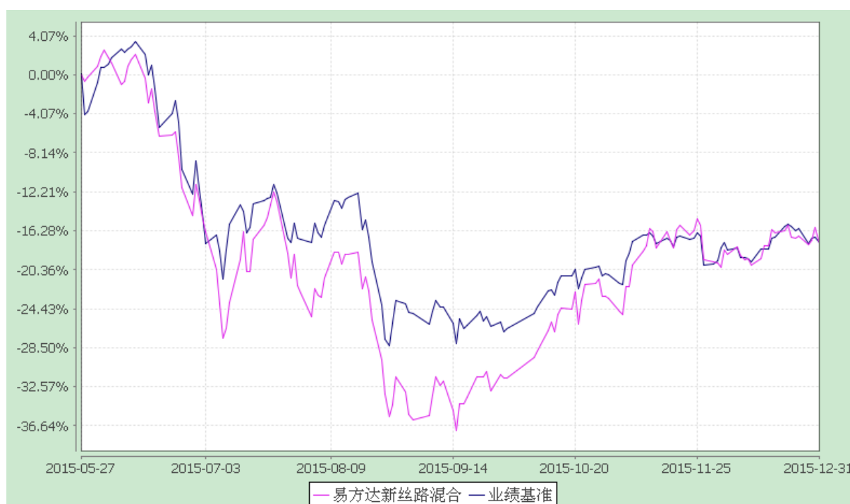
易方达新丝路灵活配置混合型证券投资基金 份额累计净值增长率与业绩比较基准收益率历史走势对比图 (2015 年 5 月 27 日至 2015 年 12 月 31 日)

注：1. 本基金合同于 2015 年 5 月 27 日生效，截至报告期末本基金合同生效未满一年。