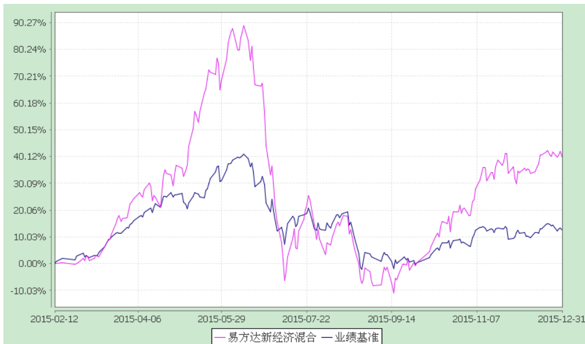
易方达新经济灵活配置混合型证券投资基金 份额累计净值增长率与业绩比较基准收益率历史走势对比图 (2015 年 2 月 12 日至 2015 年 12 月 31 日)

注：1.本基金合同于 2015 年 2 月 12 日生效，截至报告期末本基金合同生效未满一年。