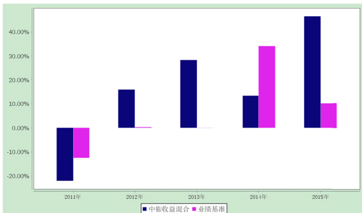
过去五年基金净值增长率与业绩比较基准收益率的对比图