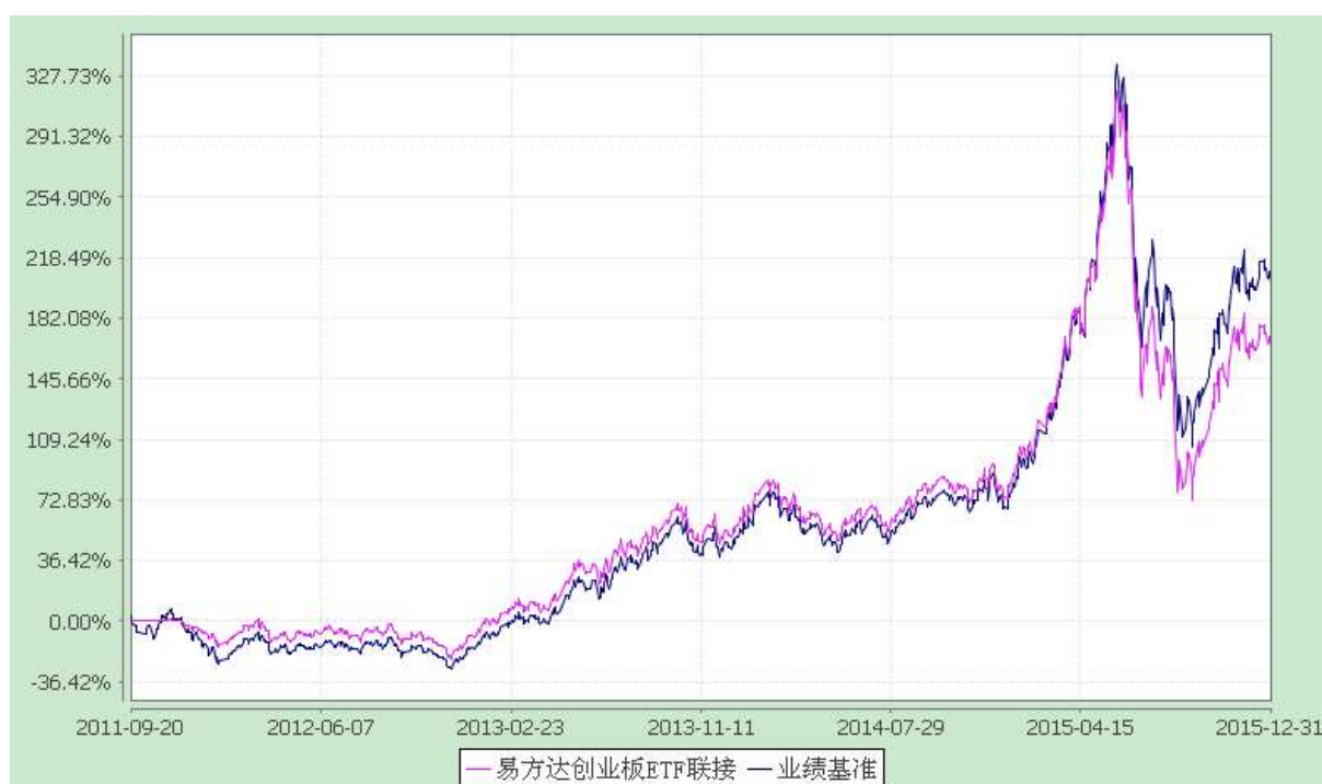
易方达创业板交易型开放式指数证券投资基金联接基金 份额累计净值增长率与业绩比较基准收益率历史走势对比图 (2011年9月20日至2015年12月31日)

注：自基金合同生效至报告期末，基金份额净值增长率为 164.78%，同期业绩比较基准收益率为 203.65%。