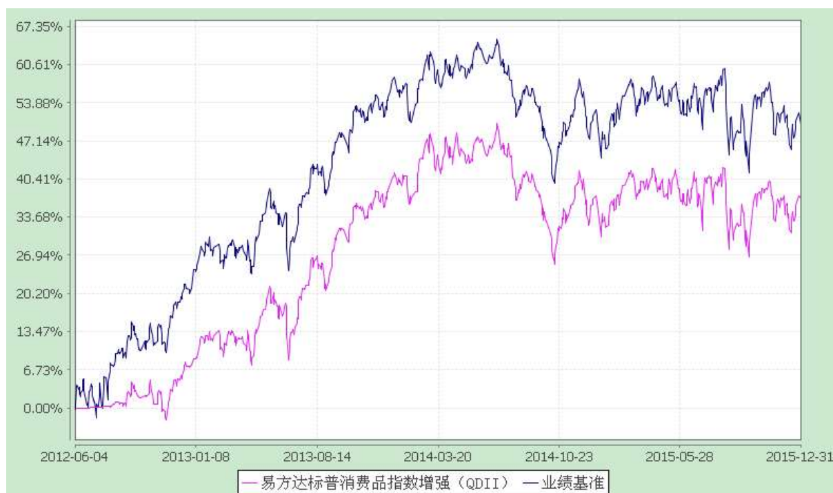
易方达标普全球高端消费品指数增强型证券投资基金 份额累计净值增长率与业绩比较基准收益率历史走势对比图 (2012年6月4日至2015年12月31日)